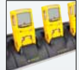
Viiden yksikön telinelaturi

Täydellisen luettelon lisävarusteista saa BW Technologies by Honeywellilta.