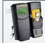
MicroDock II -yhteensopiva