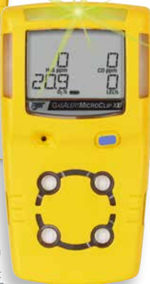
GasAlert MicroClip XL

UUSI! GasAlertMicroClip X3- ja GasAlertMicroClip XL-ilmamittarit on nyt IP68-luokituksen tasoinen suojaus pölyltä ja vedeltä. Ne kestävät jopa 45 minuutin upotuksen 1,2 metrin syvyydessä.