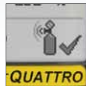
Yksinkertainen, visuaalinen vaatimustenmukaisuuden vahvistus