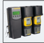
MicroDock II -yhteensopiva