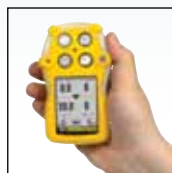
Helppokäyttöinen: vain yksi painike

Lujatekoisessa ja luotettavassa GasAlertQuattro-nelikaasuilmaisimessa on kattava valikoima yhden painikkeen toimintoja. Useiden mahdollisten virtalähteiden ansiosta GasAlertQuattro on aina käyttövalmis. Toimipisteen valvonta helpottuu graafisen LCD:n ansiosta, jonka helposti tunnistettavat kuvakkeet ilmaisevat toiminnallisia tietoja, esim. toiminnantarkistuksen ja kalibroinnin tilan. IntelliFlash antaa jatkuvasti visuaalisen vahvistuksen ilmaisimen toiminnasta ja vaatimustenmukaisuudesta. GasAlertQuattro soveltuu monenlaisiin teollisiin käyttökohteisiin, mukaan lukien suljettuihin tiloihin, ja se on täysin yhteensopiva BW:n automaattisen MicroDock II -testaus- ja kalibrointijärjestelmän kanssa.