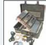
Kannettava MicroDock II -järjestelmäsarja