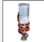
Cal Gas -seinäasennus